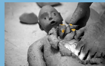
Geng Xue The Name of Gold , 2019 © GENG Xue Photo: Liu Dapeng

Muddy creatures play the leading roles in the video works of William Cobbing (1974, Great Britain). They try to get closer together, but are separated by the clay on and between their heads. They cannot touch each other but knead and grope in the dark, hoping to make contact.