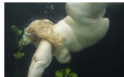
Mariken Wessels Nude, Water and Green Leaves I , 2018

Liliana Porter (1941, Argentina) exhibits her miniature people in combination with collected objects. At first sight it seems an endearing scene, but a closer look at the havoc the people cause reveals a deeper layer of creation and destruction. Mariken Wessels (1963, The Netherlands) focuses on the primal body of the obese human to make us feel the sensation of heaviness: the struggle to stand upright versus the feeling of weightlessness in water.