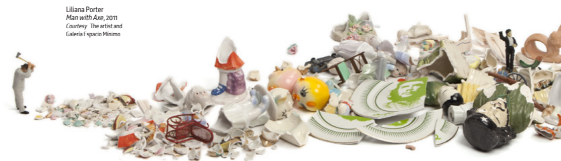
Liliana Porter Man with Axe , 2011 Courtesy: The artist and Galeria Espacio Mínimo

Liliana Porter (1941, Argentinië) exposeert haar miniatuurmensen in combinatie met verzamelde voorwerpen. Op het eerste gezicht is het een aandoenlijk tafereel, maar wie langer kijkt naar de ravage die wordt aangericht door de mensen, ziet een diepere laag van creatie en vernietiging. Mariken Wessels (1963, Nederland) focust zich op het oer-lichamelijke van de obese mens om ons zo de sensatie van zwaarte te laten voelen: de worsteling om overeind te komen tegenover het gevoel van gewichtloosheid in water.